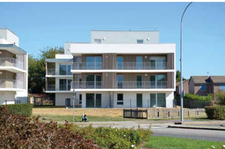
Logements collectifs à Magny Les Hameaux (78)