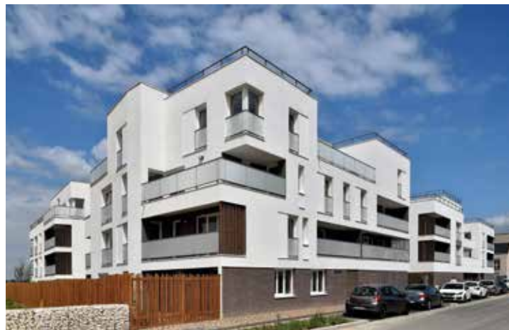
Logements collectifs et maisons individuelles à Bondoufle (91)

POSITIONNEMENT ENVIRONNEMENTAL : La création en 2008 du bureau d'études environnementales GERA'nium a permis au GERA de se développer sur des projets ambitieux. Le GERA a pu ainsi livrer des projets labellisés PASSIV HAUS à Montfort-le-Gesnois, BEPOS à Lieusaint. L'agence a également livré en novembre 2018 l'un des 15 premiers labels BBCA (Bilan Bas Carbone) en France pour un projet de résidence étudiants regroupant 230 logements en structure bois à R+5 à Noisiel.