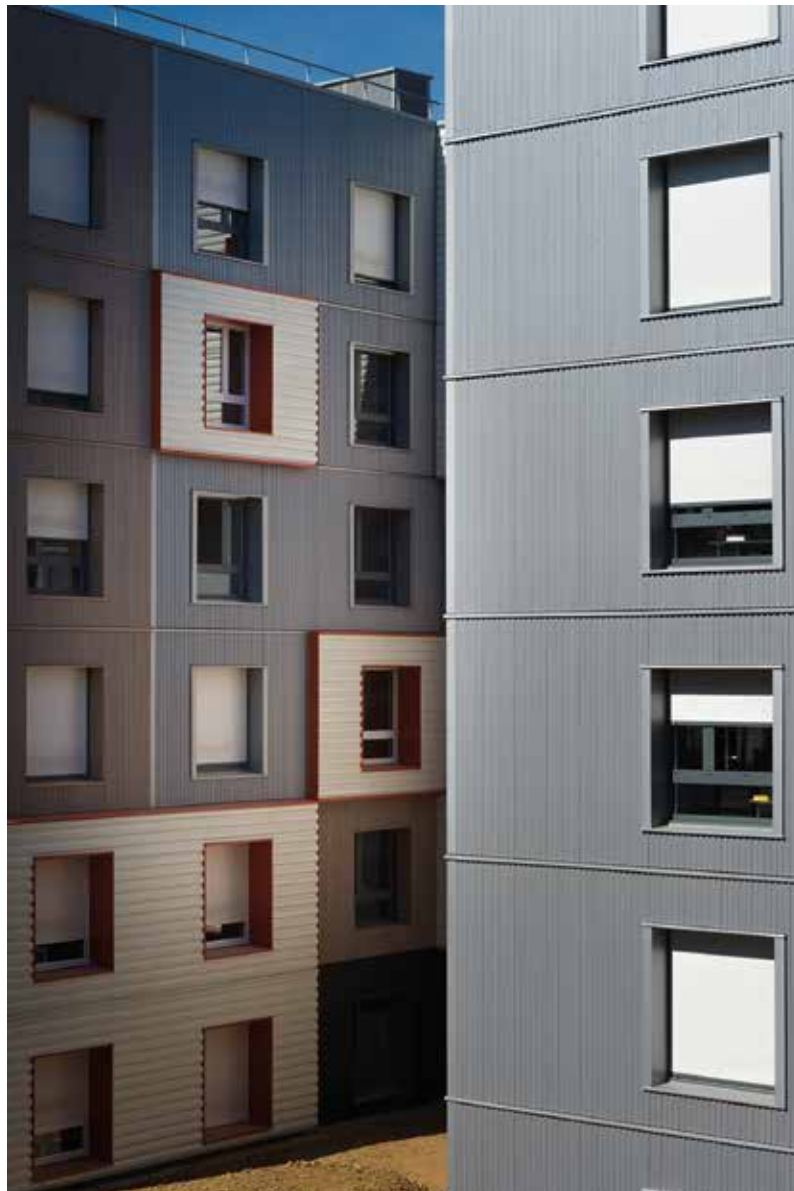
230 chambres en Résidence d'Etudiants, construction bois, label BBCA à Noisiel (77)