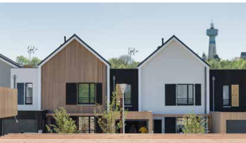
Logements collectifs et intermédiaires à Courdimanche (95)