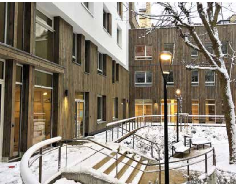
140 chambres en Foyer médicalisé et ESAT Paris (75016)