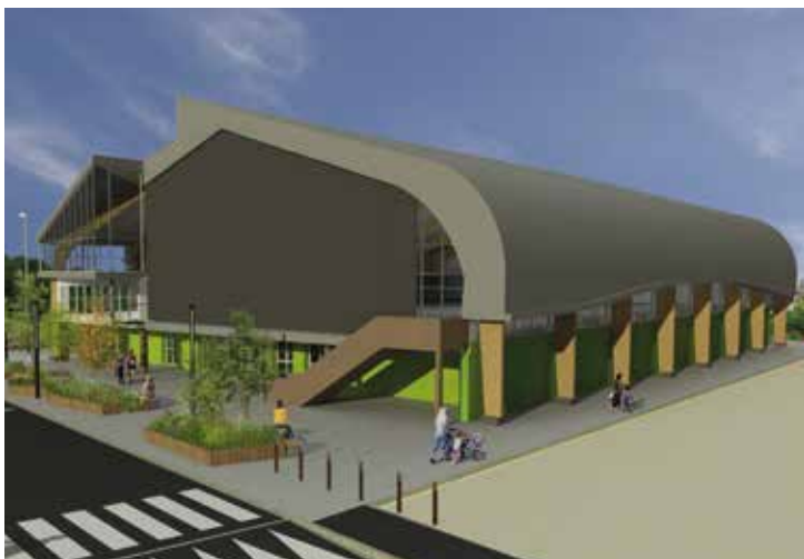
Réhabilitation du gymnase Marcel Villeneuve - Le Pec (78)