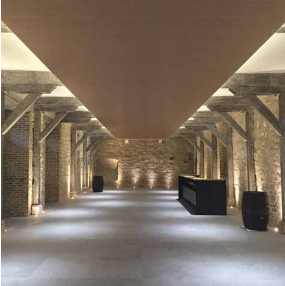
Restauration du Cellier Saint Pierre - bâtiment ISMH - Troyes (10)