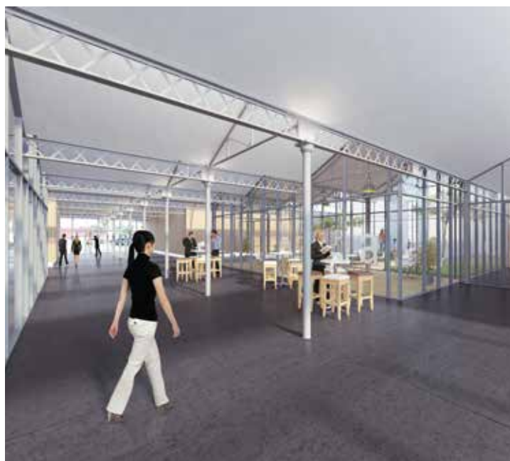
Requalification de la friche industrielle - site de l'Agora - Beaugency (45)

NOTRE PHILOSOPHIE : Depuis 28 ans, AXIS Architecture développe son positionnement sur tous les types de bâtiments, tout au long de leur cycle de vie. Nous travaillons en étroite collaboration avec notre bureau d'études intégré pour apporter à nos clients une expérience et des connaissances spécifiques dans un champ de compétence toujours plus large.