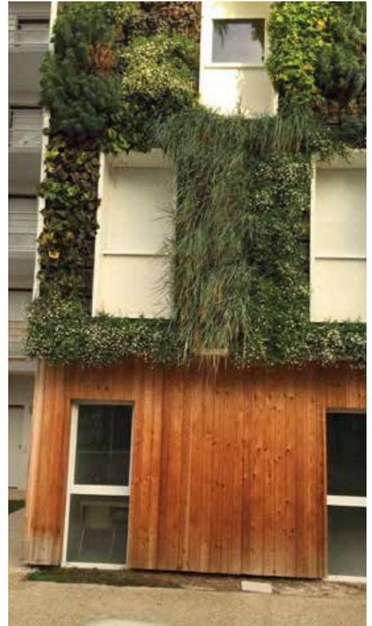
Construction de 69 logements pour étudiant à Reims - Groupe Plurial Novilia