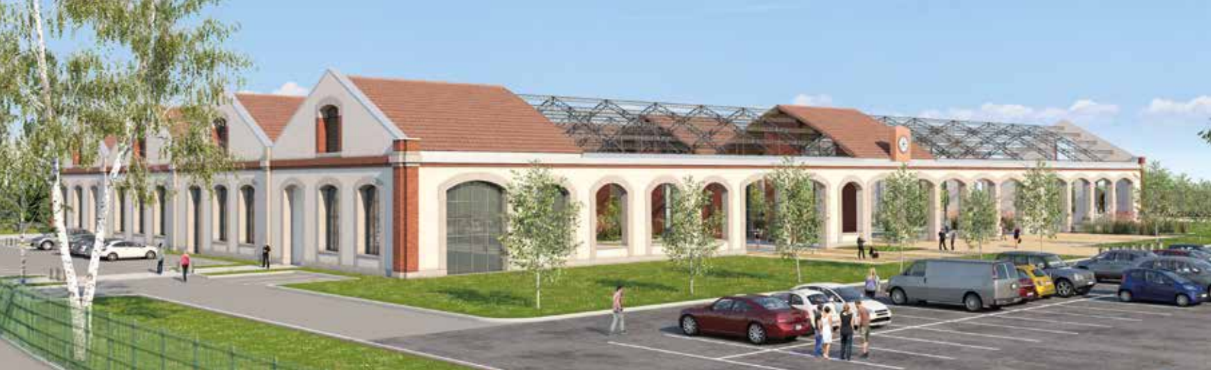
Requalification de la friche ferroviaire RFF - Château Thierry (02)