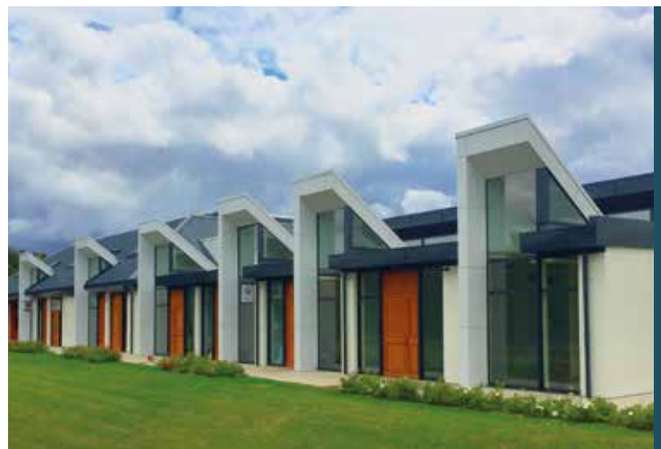
Le « Carré d'Art » - résidence d'artistes - Serris - Marne la Vallée (77)