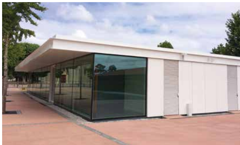
Extension de la Mairie, Lège-Cap Ferret (33), 2016.