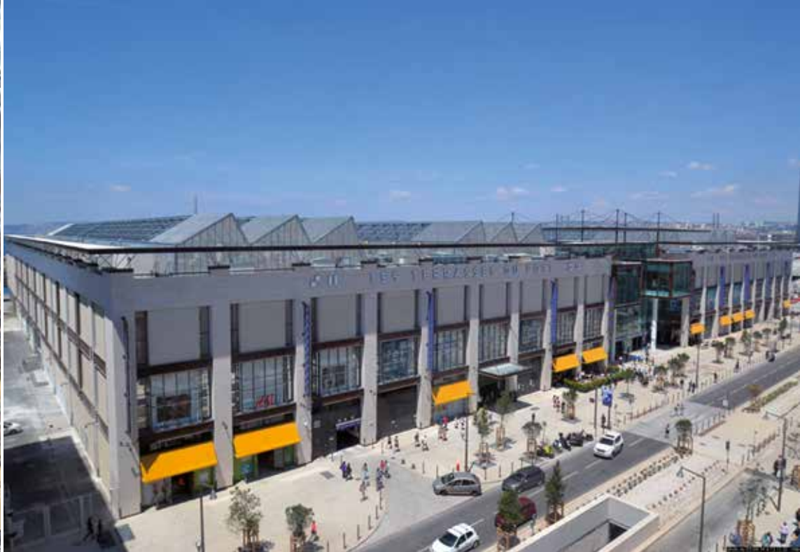
Centre commercial Les Terrasses du Port, Marseille (13), 2014.