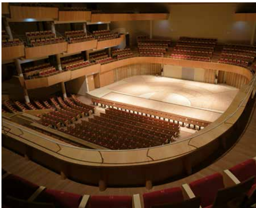
Auditorium de Bordeaux (33), 2013.