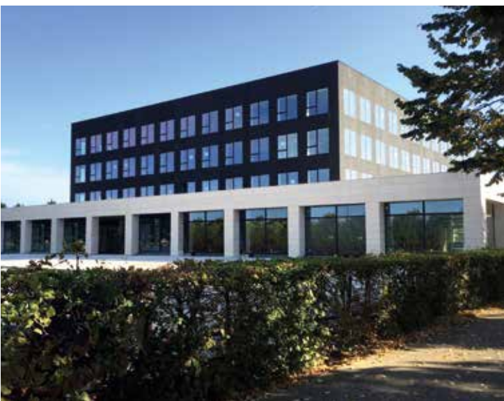
Pôle Médical, Lieusaint (77), 2018.