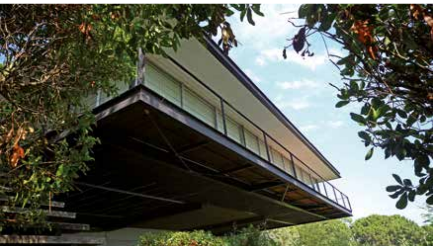
Maison Cap Ferret, Lège-Cap Ferret (33), 1971.