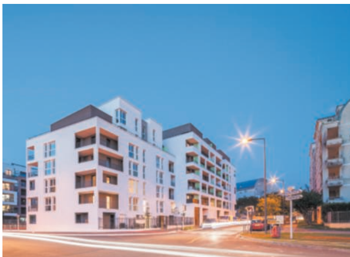
Construction de 76 logements, Cergy-Pontoise (95). Crédit Agricole Immobilier.

Des esquisses jusqu'à la réception, le projet doit devenir ce qu'il se devait d'être ; sans trahison, sans renoncement. Ce résultat doit traverser le temps sans en subir les outrages : la pérennité est une obligation éthique.