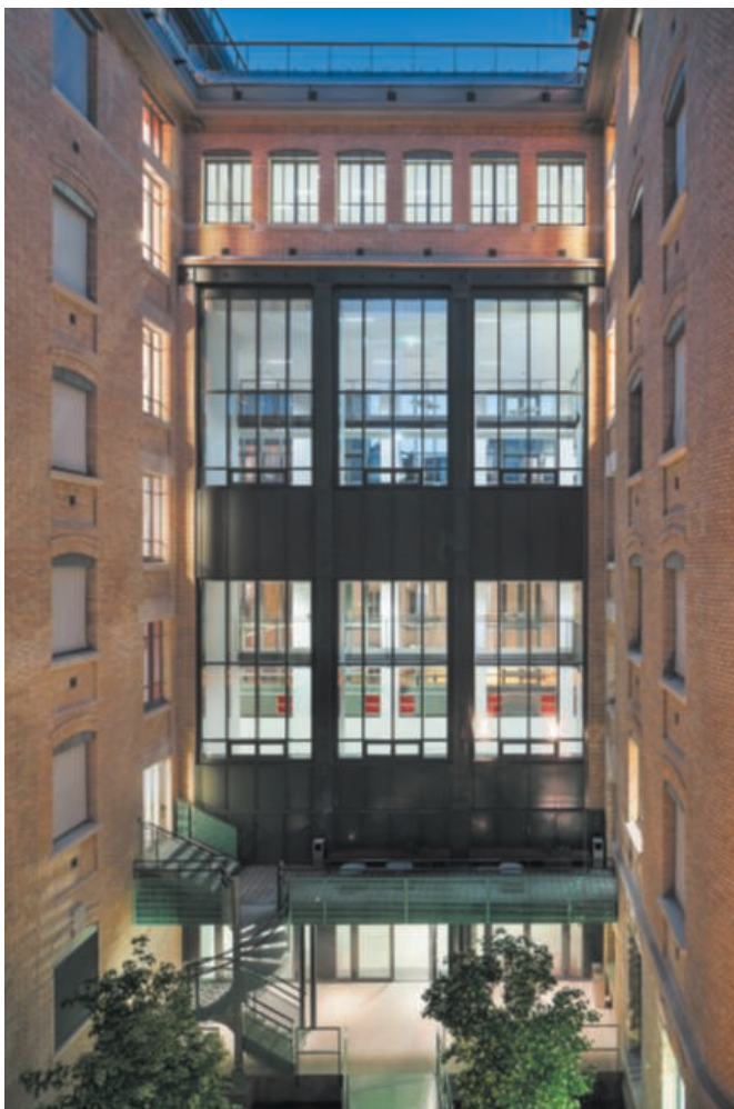
Restructuration d'un immeuble de bureaux, Paris (75016). Foncière des Régions.