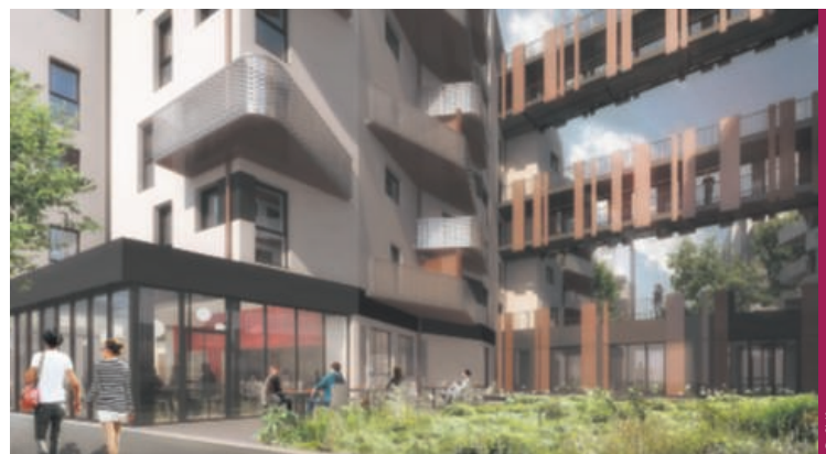
Construction d'une résidence intergénérationnelle, Gennevilliers (92). Espacil.