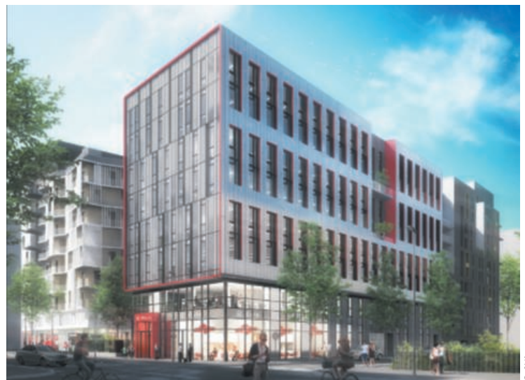
Construction d'un immeuble de bureaux, Saint-Denis (93). Vinci Immobilier.