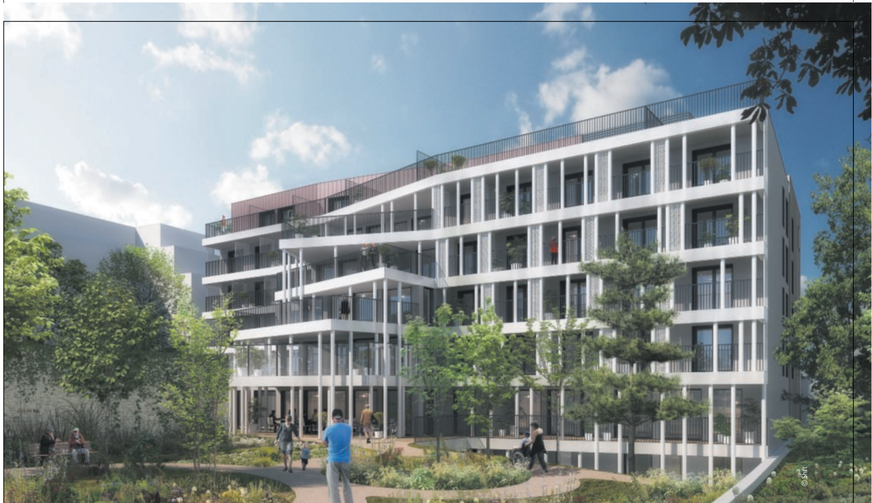
Construction d'un EHPAD, Châtillon (92). Korian.