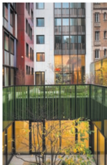
A gauche : restructuration d'un immeuble de bureaux, Paris (75017). Monceau / Axim.