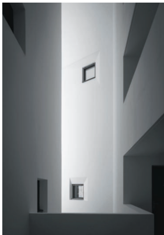
« Le Couloum » - îlot 3 – ZAC Kleber – Biarritz (64). 3 480 m2 SDP dont 34 logements sociaux, des locaux commerciaux et 3 niveaux de parkings en sous-sol. Maître d'Ouvrage : Eriila.