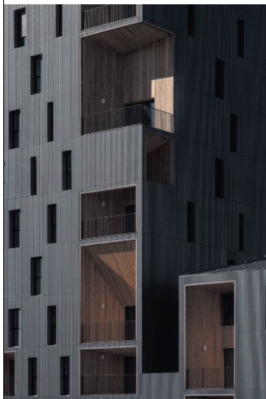
«Concert'Ô» - îlot Citram, Bassins à Flot - Bordeaux (33). 4 095 m2 SDP résidence intergénérationnelle thématique : 52 logements dédiés à la résidence dont 24 séniors et 28 familiaux. Maître d'Ouvrage : Icade Promotion.